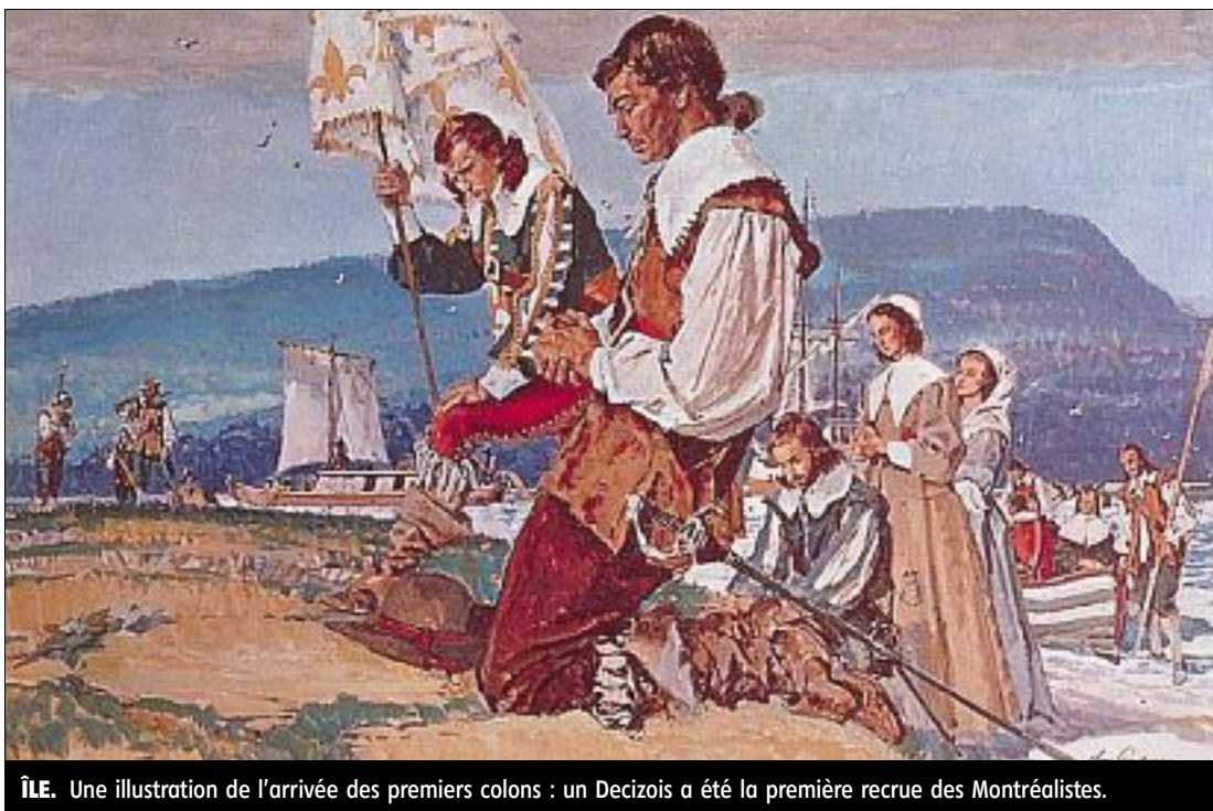
■ ILE. Une illustration de l'arrivée des premiers colons : un Decizois a été la première recrue des Montréalais.

L'historien local souligne l'aide précieuse apportée, lors de ses investigations, par l'Association des Truteau d'Amérique (*). En 2010, au détour d'un site internet canadien, il tombe ainsi sur le bulletin d'information de cette association, qui consacre une