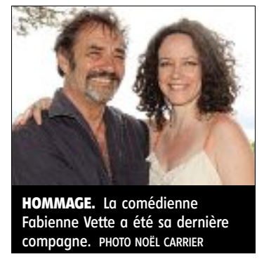
HOMMAGE. La comédienne Fabienne Vette a été sa dernière compagne.

La Dérobade , en 1979, a été le déclencheur de sa carrière. Décédé le 9 octobre 2013, l'acteur-réalisateur est un enfant de l'Assistance publique, placé, à 9 ans, à La Chapelle-aux-Chasses (Allier). Il est revenu tourner sur ses terres autant qu'il a pu. On se souvient notamment du Temps des porte-plumes . ■