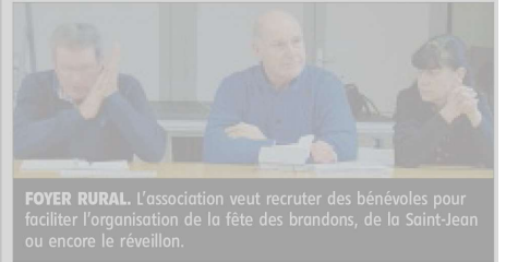
FOYER RURAL. L'association veut recruter des bénévoles pour faciliter l'organisation de la fête des brandons, de la Saint-Jean ou encore le réveillon.