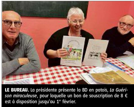
LE BUREAU. La présidente présente la BD en patois, La Guérison miraculeuse , pour laquelle un bon de souscription de 8 € est à disposition jusqu'au 1 er février.

Il ne reste que quelques jours pour souscrire (8 €), jusqu'au 1 er février, mais il sera encore possible d'acquérir un exemplaire de la publication après la souscription, notamment à l'occasion d'une journée de présentation en février à Chevagnes, ainsi que les samedi 9 et dimanche 10 mars, au Festi BD, à