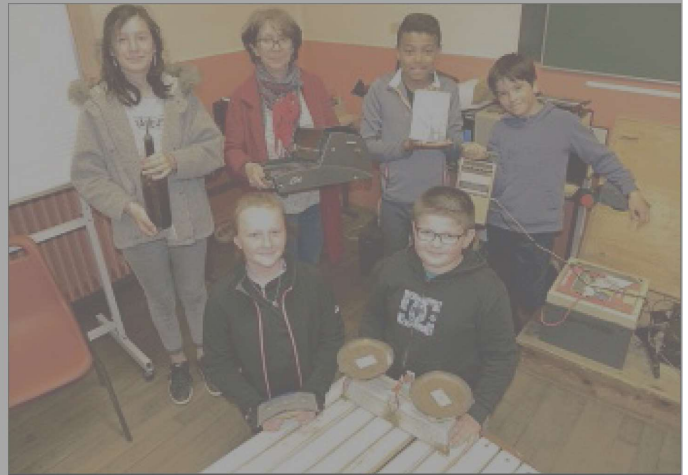
CHOIX. Le public pourra venir chiner parmi tous les anciens matériels scolaires.

Du mobilier, des manuels scolaires, des anciennes plumes, etc