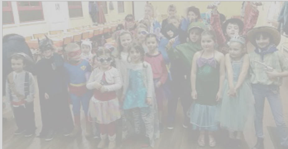
MARDI GRAS Les pirates, cow-boys, batman et autres personnages hauts en couleurs avaient investi la salle des fêtes pour l'occasion.

La prochaine manifestation organisée par l'amicale laïque sera un concours de belote, dimanche 3 mars, à 13 h 30, à la salle des fêtes. ■