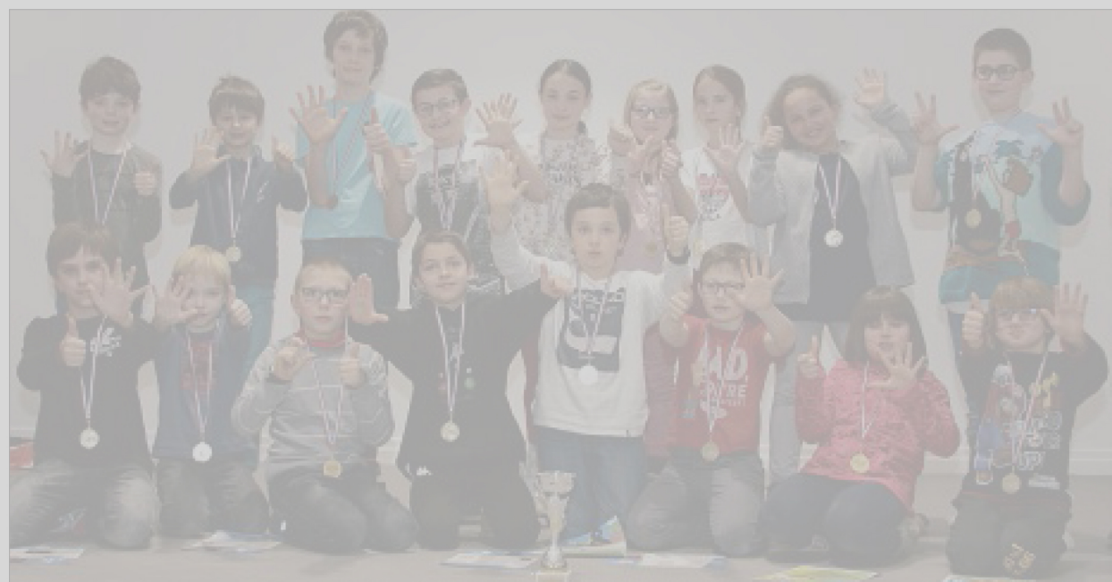
ÉQUIPE. L'école de Saint-Menoux est championne départementale pour la sixième année consécutive.

Mercredi dernier, à la salle polyvalente de Montbeugny, soixante élèves des écoles primaires ont participé au championnat départemental des échecs scolaires. Après sept rondes de 2 x 15 minutes,