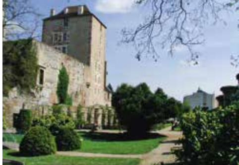
La Mal-Coiffée et les jardins bas du château