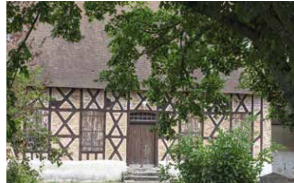
Ancienne cure à Lusigny

Chapelle Notre-Dame, hôtel de Paris, 21 rue de Paris, Moulins, à 18h