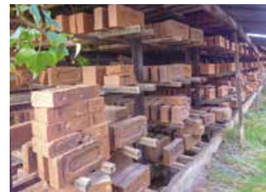
Tuilerie de Bomplein à Couzon

RDV sur le parvis de l'église prieurale de Souvigny