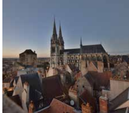
Vue de la cathédrale de Moulins et de la Mal-Coiffée depuis le Jacquemart