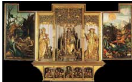
Le retable d'Issenheim