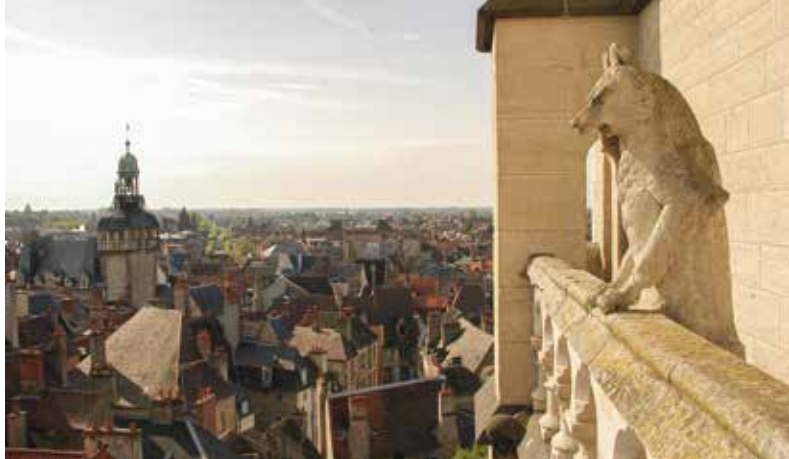
Vue sur Moulins depuis la cathédrale