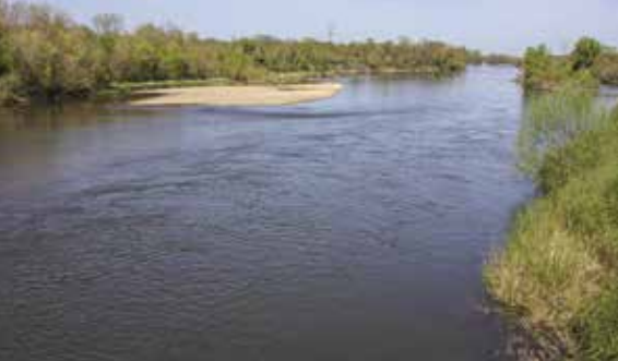
La rivière Allier à Villeneuve