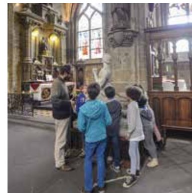
Visite lors des ateliers du patrimoine

De 14h30 à 17h, sur réservation. Les places sont à retirer à l'avance à l'Espace patrimoine. L'atelier se compose d'un temps de visite et d'explication suivi d'un goûter apporté par l'enfant, puis d'une réalisation manuelle à emporter. Tarif : 6 € par atelier, 3 € avec la carte patrimoine