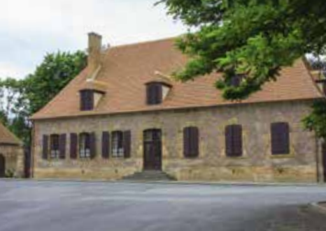
Maison dite la Grosse Maison à Chevagnes