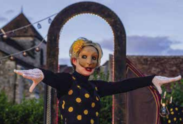
La Troupe itinérante masquée La Parade