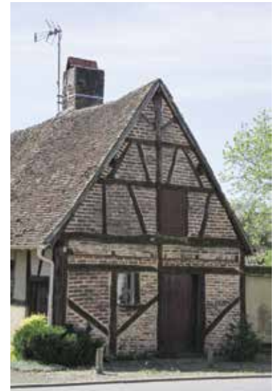
Maison du XVIII e siècle, Auroüer

Salle des fêtes de Chevagnes, Route Nationale, à 19h, dans le cadre de l'exposition Vers un Pays d'art et d'histoire présentée à la mairie de Chevagnes.