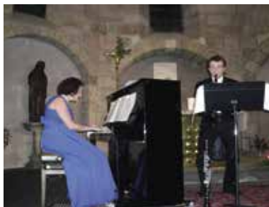
Concert à la chapelle Sainte-Claire de Moulins

RDV au pied du Jacquemart, 12 place de l'Hôtel de Ville