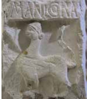
Colonne du Zodiaque, détail, musée de Souvigny