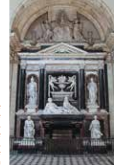
Mausolée du duc de Montmorency, chapelle Saint-Joseph, ancienne Visitation