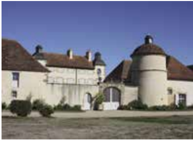
Le château de Charnes à Marigny