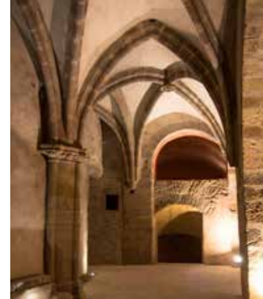
Les caves Bertine