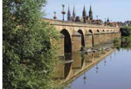
Moulins, Pont Régemortes