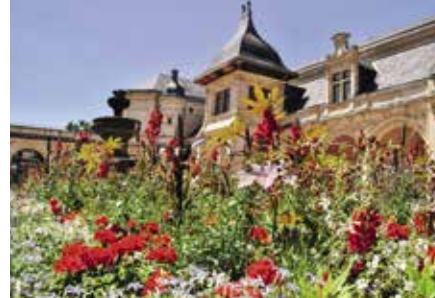
Le pavillon Anne-de-Beaujeu