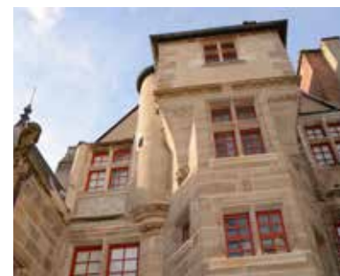
La cour de l'hôtel du Doyenné

Réservation conseillée. RDV à l'Espace patrimoine, 83 rue d'Allier