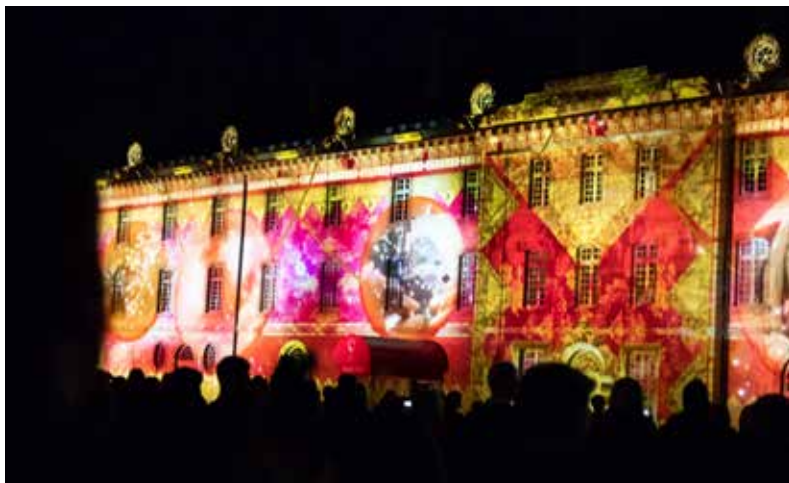
Moulins entre en scène, façade du Centre national du costume de scène