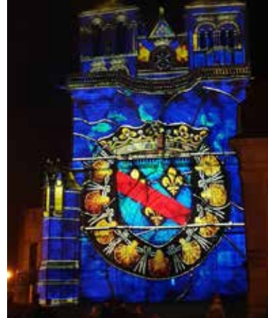
Moulins entre en scène, église prieurale de Souvigny

RDV sur le parvis de la cathédrale, place de la Déportation. Se munir de jumelles