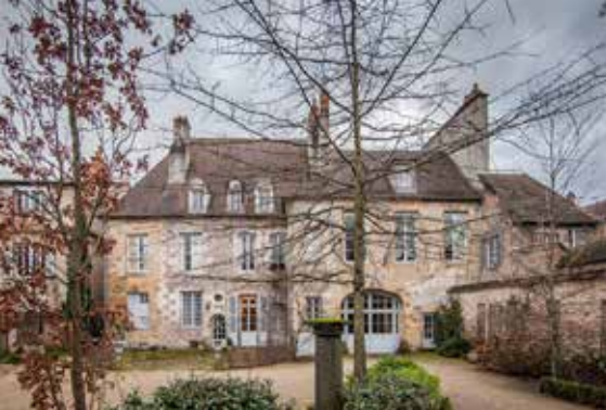
Façade sur cour de l'hôtel de Conny