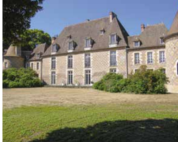
Château de Pomay à Lusigny