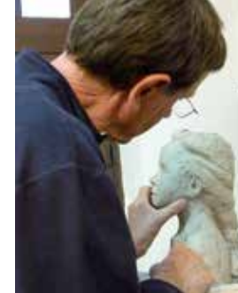
Atelier modelage adultes