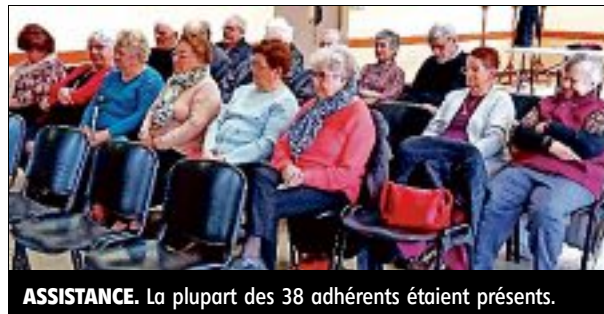
ASSISTANCE. La plupart des 38 adhérents étaient présents.

Le rapport d'activité 2022 est présenté par la secrétaire. La section compte 38 adhérents, anciens combattants, veuves ou sympathisants. Les projets pour 2023 ont également été évoqués : cérémonie du 8-Mai ; commémoration départementale à Saint-Pourçain-sur-Sioule, en septembre.