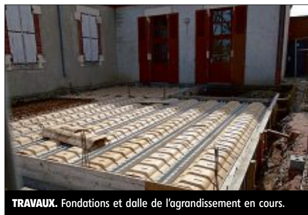
TRAVAUX. Fondations et dalle de l'agrandissement en cours.

Le gros chantier de la salle polyvalente a débuté avec l'agrandissement sur un côté comprenant une pièce et une remise pour le matériel.