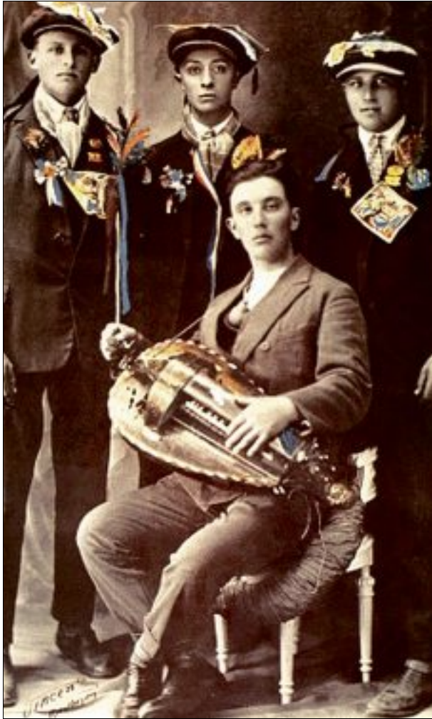
TÉMOIGNAGES. Les photos de conscrits sont des témoignages précieux des traditions propres à chaque époque.

Une exposition présentée à la ferme d'Embraud depuis juillet 2022 et intitulée Vive la Classe, la conscription en Bourbonnais retrace les différents aspects et étapes liés à la conscription, qu'ils soient officiels (tirage au sort, visites médicales, réfractaires, déserteurs) ou festifs