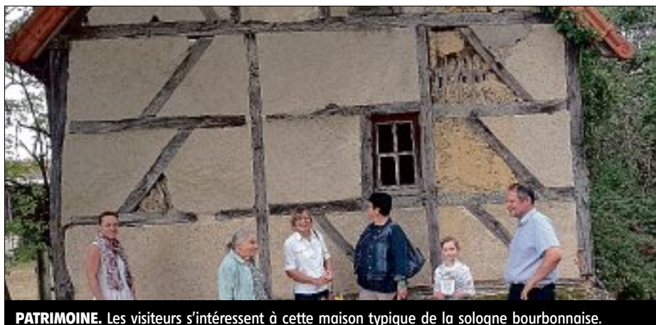
PATRIMOINE. Les visiteurs s'intéressent à cette maison typique de la sologne bourbonnaise.

Le torchis est un mélange de terre argileuse et le