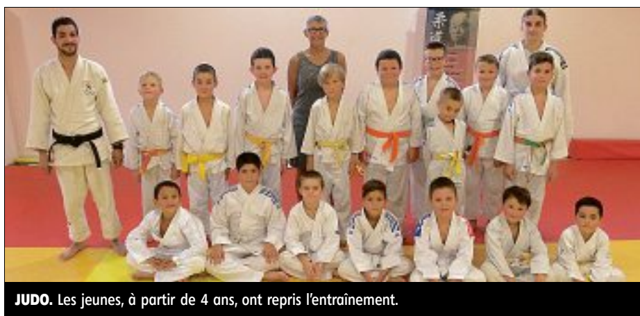
JUDO. Les jeunes, à partir de 4 ans, ont repris l'entraînement.

■ judo jeunes (nés en 2012 et avant), lun-