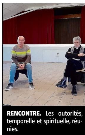
RENCONTRE. Les autorités, temporelle et spirituelle, réunies.

Après une visite de l'église, accompagné de la présidente de l'association pour la restauration de l'église Saint-Julien, le curé a rejoint la salle polyvalente pour rencontrer