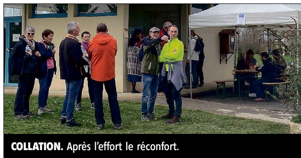
COLLATION. Après l'effort le réconfort.

L'association « Pour Pierrefitte » a organisé une matinée randonnées sur la commune. Trois circuits de 6, 10 et 13 km étaient proposés avec un départ échelonné dès 9 h 30. Plus de soixante personnes y ont participé sous une