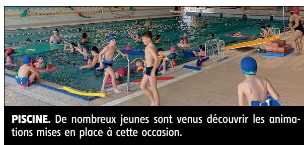
PISCINE. De nombreux jeunes sont venus découvrir les animations mises en place à cette occasion.