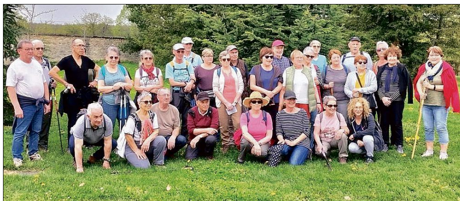
MARCHE A MARIGNY. Un temps clément, un village charmant, une bonne ambiance.

Prochain rendez-vous dimanche 5 mai, à Charroux, pour une randonnée à la journée. ■