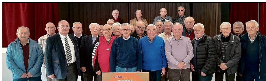
UNC. En avant-première, les écussons regroupés sur un seul tableau qui sera inauguré le 20 avril.

L'UNC compte 350 adhérents répartis entre 17 sections dans le département