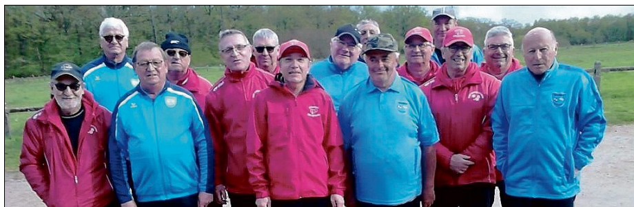
LES VÉTÉRANS DE LA PÉTANQUE. Les compétitions ont repris avec un bon démarrage.

Les compétitions de club ont repris pour la Fanny paraysienne. En championnat des clubs, dans la catégorie vétérans, l'équipe A a obtenu trois victoires contre Vichy, Creuzier-le-Vieux et Saint-Menoux, et a subi une défaite à Abrest. L'équipe B a enregistré quatre victoires contre Châtel-de-Neuvre, Treban, Neuvy et Trévol. ■