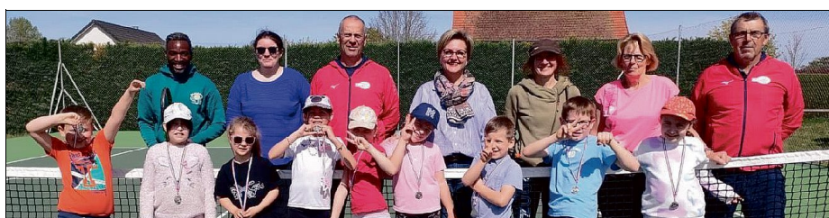
TENNIS. L'enthousiasme des élèves, élue et éducateurs fait plaisir à voir.