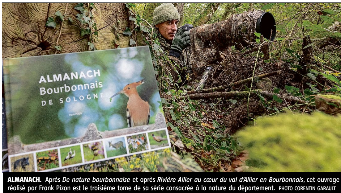
ALMANACH. Après De nature bourbonnaise et après Rivière Allier au cœur du val d'Allier en Bourbonnais , cet ouvrage réalisé par Frank Pizon est le troisième tome de sa série consacrée à la nature du département.

■ L'Almanach Bourbonnais, pourquoi ? 365 jours... « Le défi est un peu fou », s'amuse Frank Pizon. Mais nécessaire pour faire découvrir la nature au rythme de sa transformation annuelle : « Alors, méticuleusement, avec patience et persévérance, je me suis attelé à la tâche pour vivre un an durant au rythme de la campagne ». Si certains urbains ont tendance à associer la ruralité à la lenteur, Frank Pizon (dé)montre, photos à l'appui, que la réalité est tout autre : « Tout va vite dans la nature. Cet enchaînement rapide a rendu ma tâche plus ardue pour garder la trace des principales étapes ». Mais cet almanach tissé au fil des saisons ne poursuit pas vraiment une ambition d'exhaustivité. Il se feuillette plutôt comme une grande contemplation, comme un monologue intérieur tourné vers l'extérieur, comme une ode à une campagne où co-